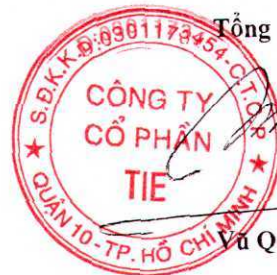
Vu Quốc Vinh